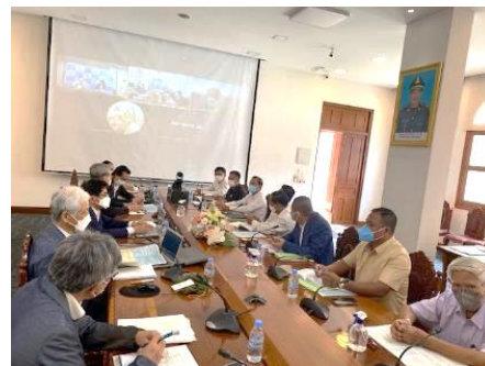
キックオフミーティング 久しぶりの活動再開

なお、キックオフミーティングはリモート参加(北九州市)とのハイブリッド形式で実施するために、プロジェクター映像が良く見えるように小会議室が使用されました。今までは、参加者が多いということもありましたが、大会議室で実施しており、対面ではあるものの、私たちとカウンターパートとの距離は約4m程度ありました。小会議室では写真からも分かるように1m程度と近くなり、マスクをつけていても顔の表情が良くわかります。そして、冒頭の副知事の挨拶時に、私をじっと見て「ちょっと老けましたね。」とジョークを交えて話が進みました。COVID-19下で現地への渡航は間が開いてしまいましたが、両者の関係性は良好であることを物語る一場面だと思います。