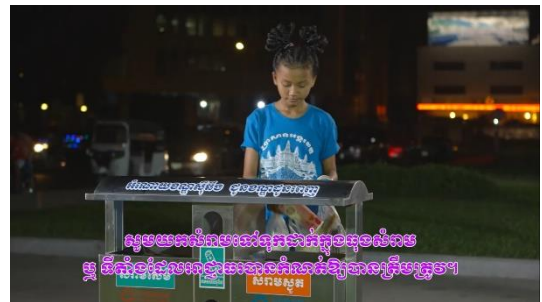
ごみは放置せずにごみ箱に捨てましょう