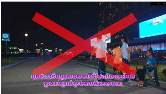
ごみ出しルールを守りましょう

到達すべき方向性や内容は万国共通であると思いますが、現地に沿った形でカスタマイズすることが必要であり、啓発ビデオ制作においても現地での適正化が望まれます。